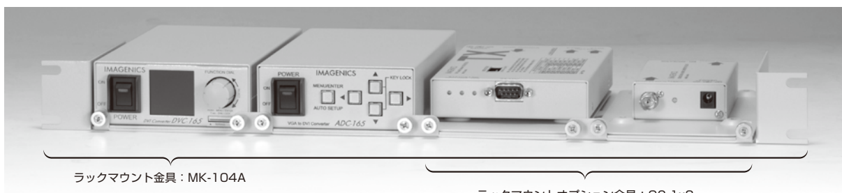
ラックマウント金具：MK-104A