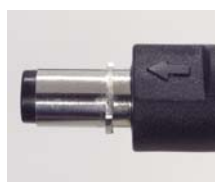
— プラグ側 —