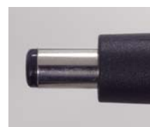
— プラグ側 —

仕様および外観は、改良のため予告なく変更することがありますのであらかじめご了承ください。