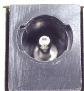
— ジャック側 —