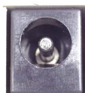
— ジャック側 —