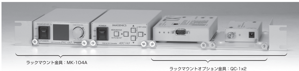
ラックマウント金具：MK-104A