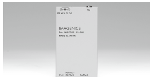
PU-PH1 FRONT PANEL

DVI/HDMI関連の機器・ケーブルは、すべて弊社製品での構成を推奨します。一部の他社製品(海外製を含む)との混在組み合わせでは、規定の性能を維持できず思わぬ不具合が発生する場合があります。この場合、弊社製品の動作を保証できない場合があります。