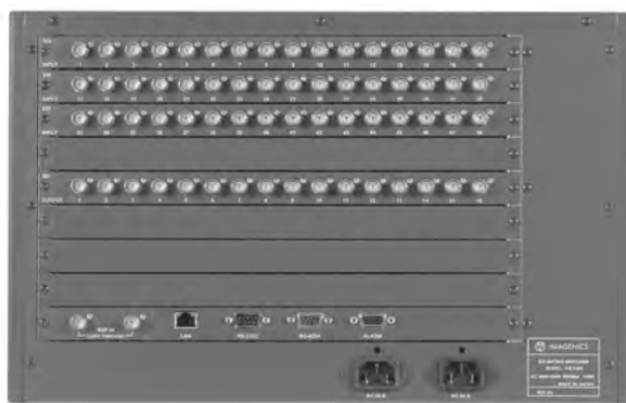
ISX-6464/4816 REAR PANEL