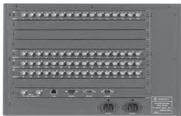
ISX-6464/1648 REAR PANEL