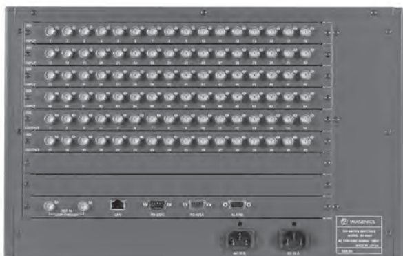
ISX-6464/6432 REAR PANEL