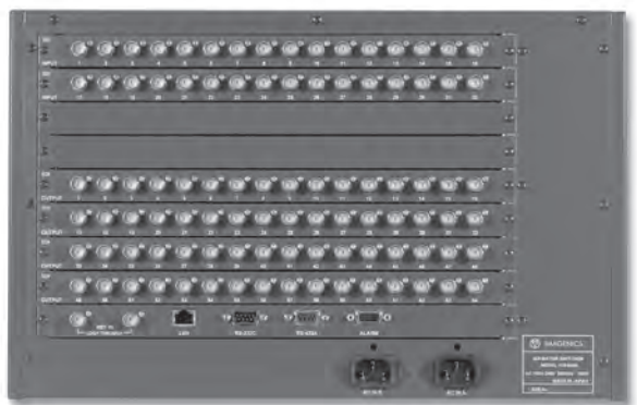
ISX-6464/3264 REAR PANEL